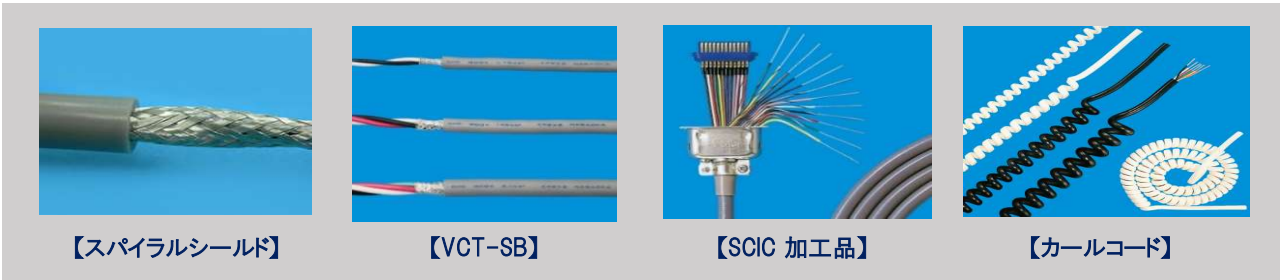
【スパイラルシールド】